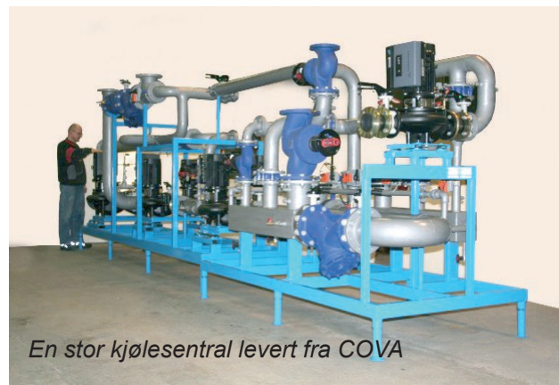
En stor kjølesentral levert fra COVA

Alle ønsker å ha så god økonomi i byggeprosjektet som mulig. Har du regnet på all dødtid som medgår ute på byggeplassen? Har du regnet på hvilke administrasjonskostnader som medgår? Og hva med feilkostnader og annet som oppstår? I sannhet ligger her betydelig mulige besparelser. Få hele varme/kjøleanlegget i teknisk rom levert ferdig til byggeplassen – det sparer du mye på!